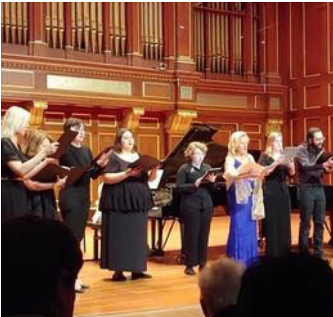
Исполнение Гимна Украины перед концертом

И вкратце рассказал о самом композиторе. Астор из поколений прошлого века. Родился в 1921 году. Ему бы сегодня было 100 лет. Он аргентинец, из итальянских эмигрантов, но больше жил в Нью-Йорке и Париже. И тогда же прослыл самым востребованным.